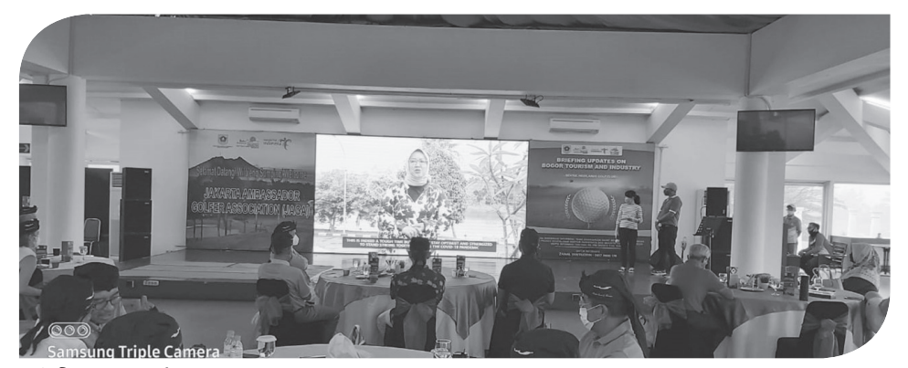
Briefing Wamenlu RI.

Dia optimis, dengan troban yang dilakukan Pemerintah Kabupaten Bogor, serta semangat juangnya untuk membangkitkan perekonomian. Semoga bisa melalui masa